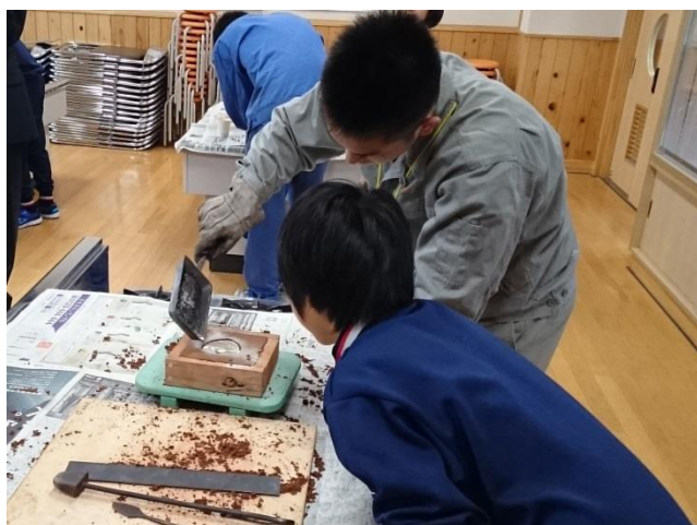
6年生 簡易鋳造 (機械科)