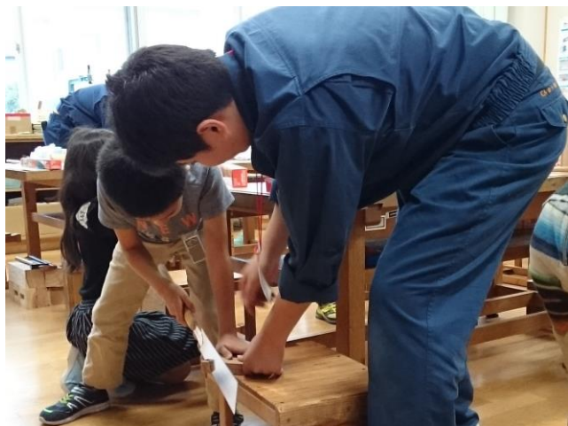
3年生 釘打ちトントンのこぎりぎこぎこ (土木・建築科)

機械科、電気科、土木・建築科、生活科学科の生徒が城西小学校に出向き、ものづくりや体験を通して交流しました。