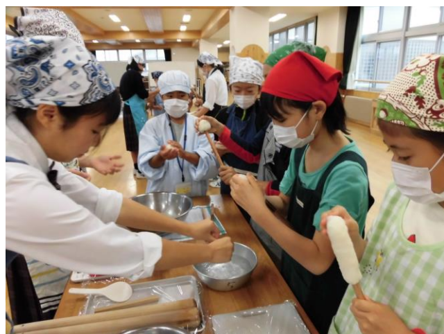
5年生 みそつけたんぼ作り (生活科学科)