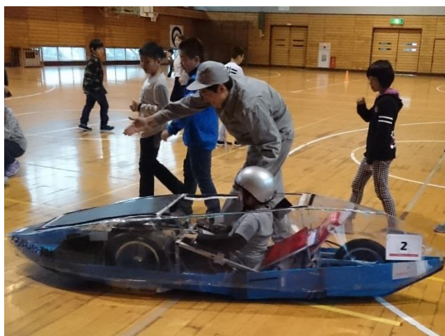
4年生 バッテリーカー試乗 (機械科)